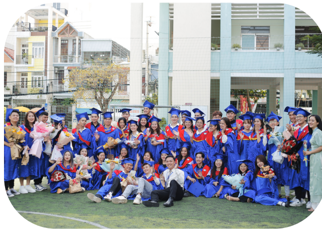
Cựu sinh viên khóa 2019-2022