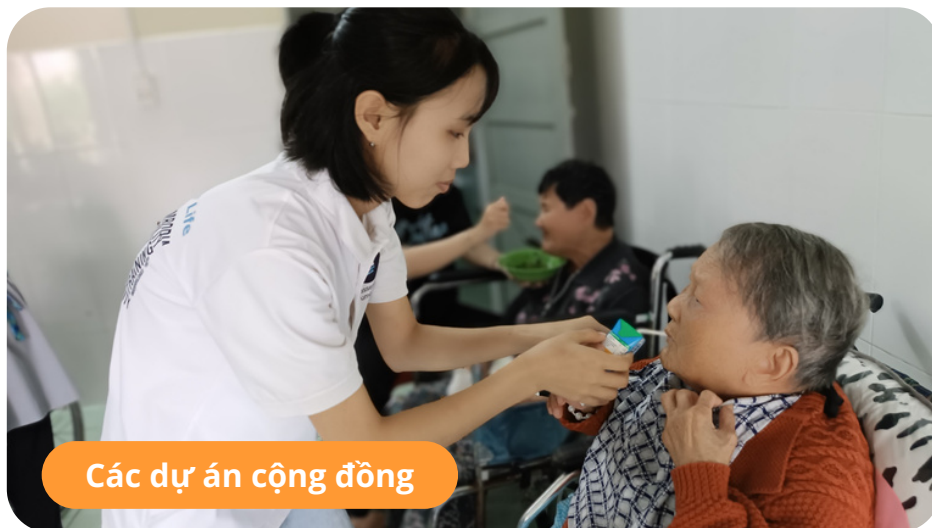
Các dự án cộng đồng