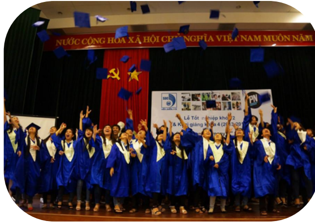
Cựu sinh viên khóa 2011-2013