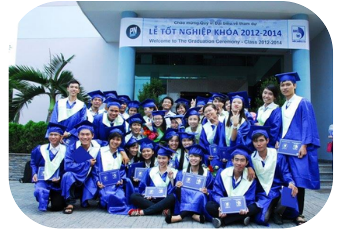
Cựu sinh viên khóa 2012-2014