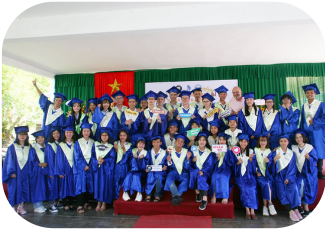
Cựu sinh viên khóa 2016-2019