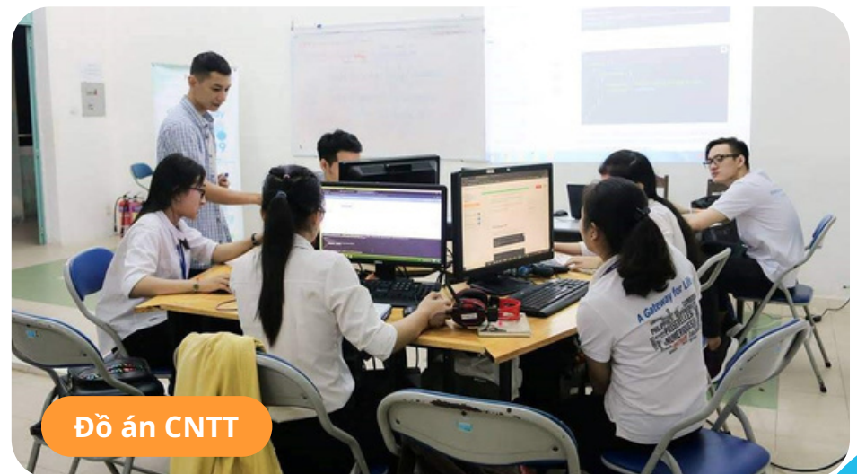
Đồ án CNTT