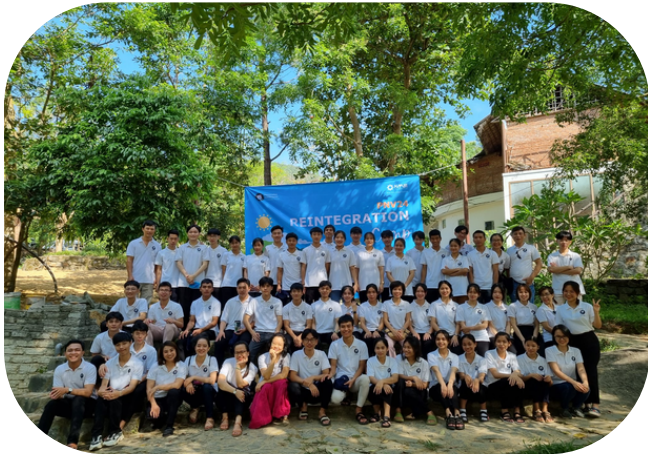
Cựu sinh viên khóa 2021-2024