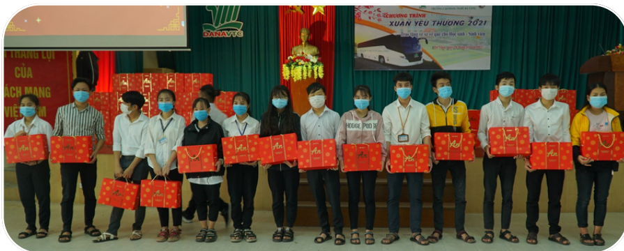
Hàng năm, cựu sinh viên luôn tổ chức hoạt động trao quà Tết cho các em khóa dưới