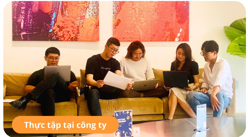
Thực tập tại công ty