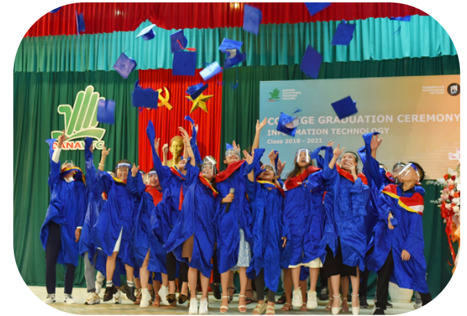
Cựu sinh viên khóa 2018-2021