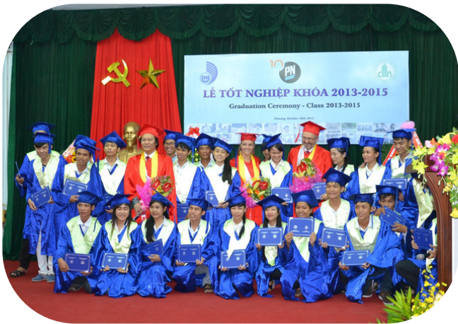
Cựu sinh viên khóa 2013-2015