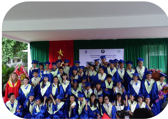
Cựu sinh viên khóa 2014-2016