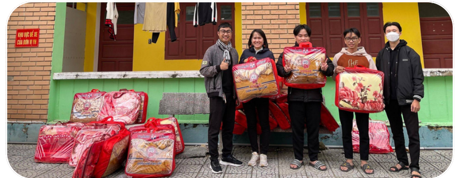
Cựu sinh viên trao tặng 30 chiếc chăn ấm áp để đàn em có thể vượt qua cái giá lạnh của mùa đông 2022