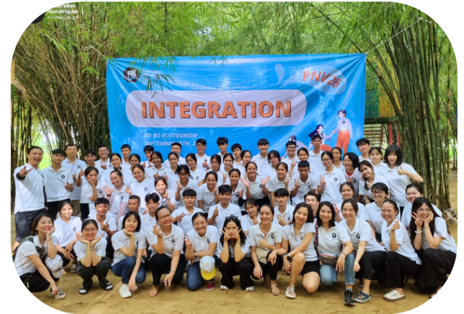
Cựu sinh viên khóa 2022-2026