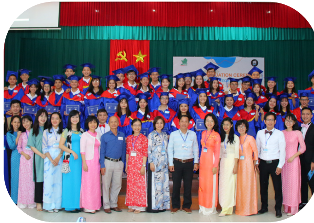
Cựu sinh viên khóa 2017-2020