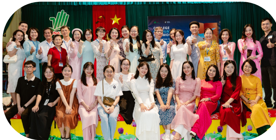
Nhân viên & Giáo viên của PNV