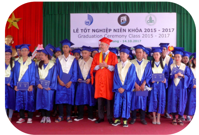
Cựu sinh viên khóa 2015-2017