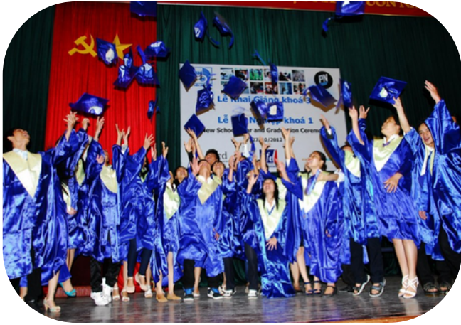
Cựu sinh viên khóa 2010-2012

BẠN CÓ BIẾT?: Trước đây, chương trình của PNV chỉ kéo dài 2 năm hệ Trung cấp. Từ năm 2017, PNV quyết định nâng cấp chương trình đào tạo lên hệ Cao đẳng để các sinh viên của mình có thể thêm cơ hội cạnh tranh khi tiến ra thị trường lao động.