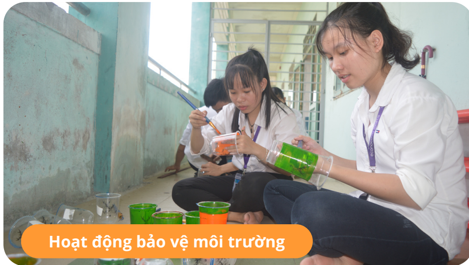
Hoạt động bảo vệ môi trường