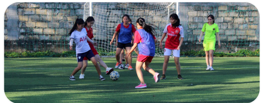
Giải Bóng đá PNV mở rộng với sự tham gia của các cựu sinh viên, sinh viên và nhân viên PNV