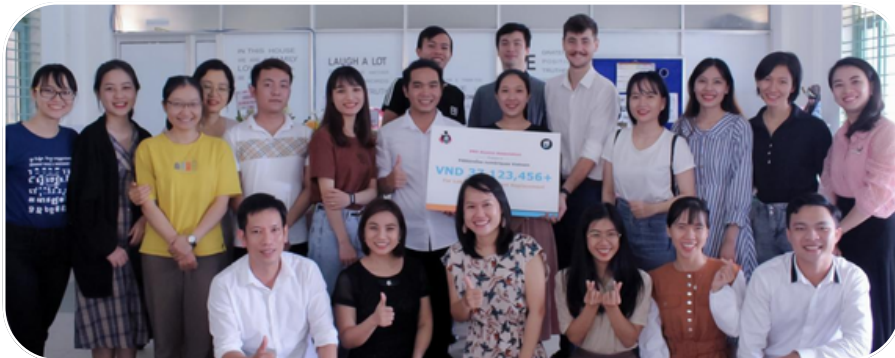
Cựu sinh viên chung tay sửa lại phòng máy tính tại PNV bị hư hỏng do bão lũ vào tháng 10/2020